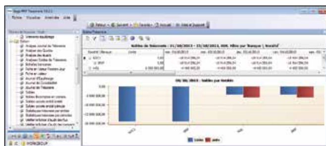
Indicadores de seguimiento de tu actividad